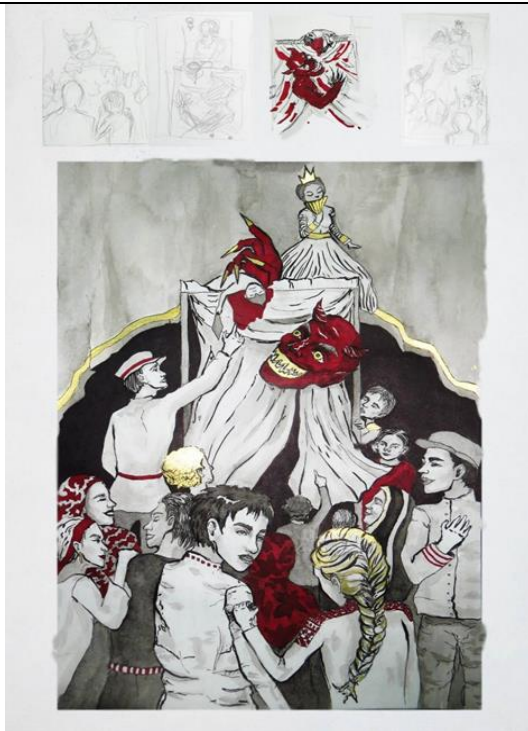
Пример задания по композиции № 1:

Вот открыт балаганчик Для веселых и славных детей,